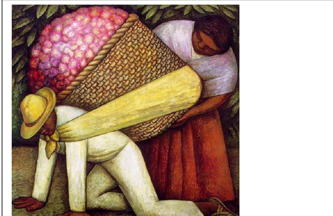
Diego de Rivera: El acarreador de flores.