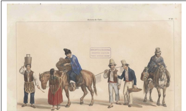
Claudio Gay: Vendedores ambulantes en la

II.- Observa las siguientes obras y contestas las preguntas.