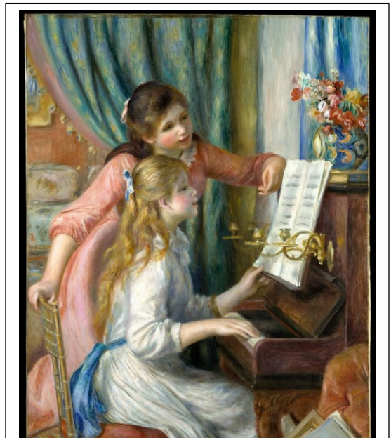
Auguste Renoir: Niñas en el piano

¿Qué actividades podemos observar en estas obras?