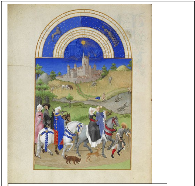
Obra El Libro de las buenas horas del duque de Berry (Limbourg)